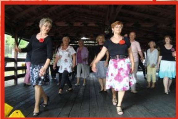
PIKNIK INTEGRACYJNY - czerwiec 2016