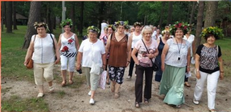
Miedzna Murowana koło Opoczna