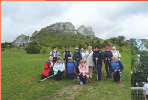
Olsztyn k. Częstochowy