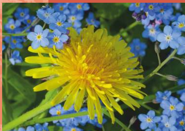
Kwiaty uśmiechem rośliny