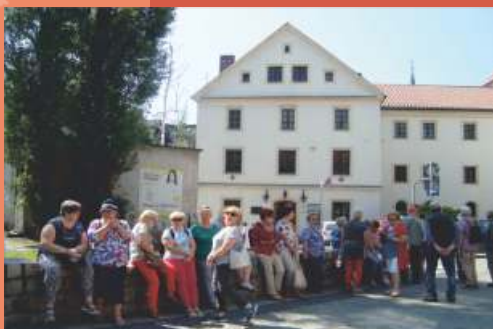
Gliwice - Pałac Piastowski