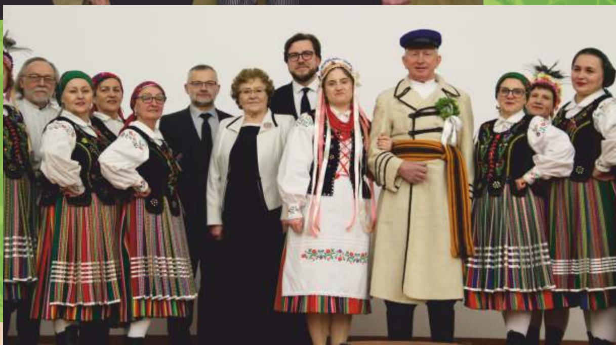
Dzień Babci i Dzień Dziadka